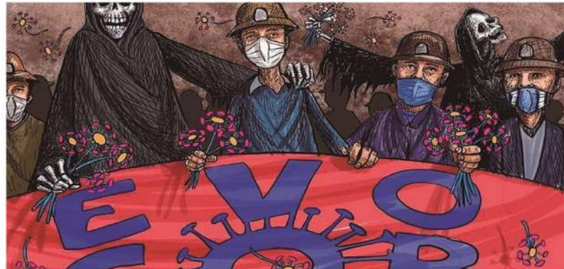
Raul Peñaranda U. @RaulPeñaranda1 · 12h

10:02 a. m. · 8 ago. 2020 · Twitter Web App